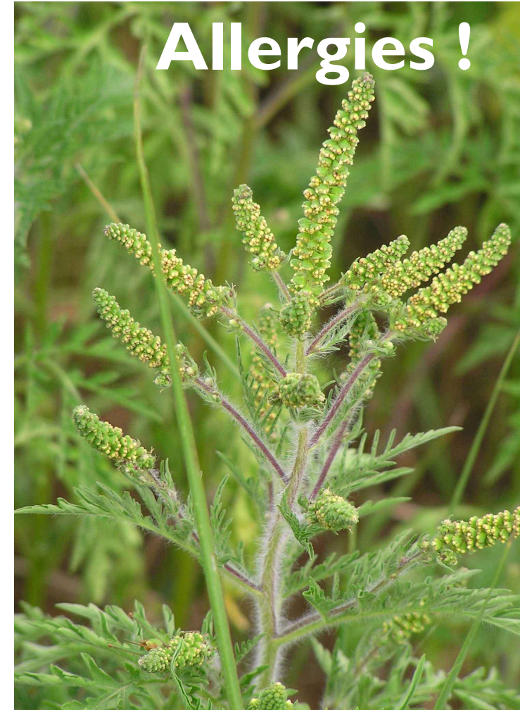
AMBROISIE À FEUILLES D'ARMOISE